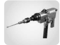
ROLLING MOTORS → CHAPTER PAGE 40